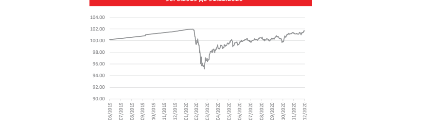
Извор: Триглав прво пензиско друштво АД Движење на вредноста на сметководствената единица за период од 30. 6.2019 до 31.12.2020